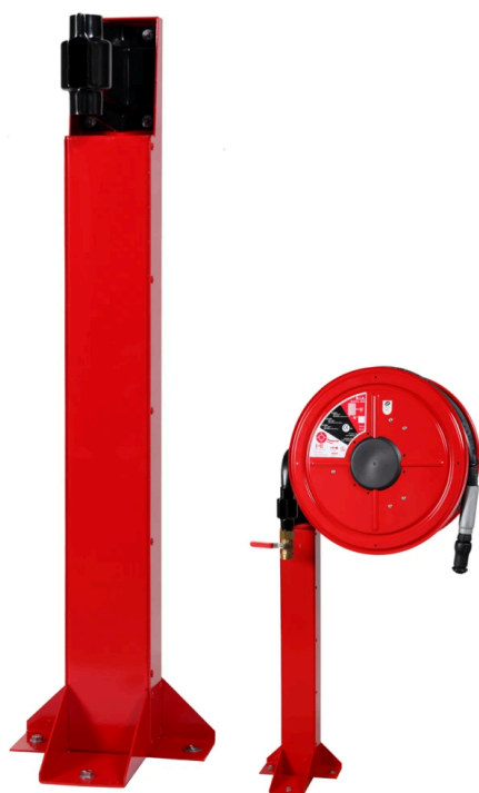
Potence R.I.A. pivotant tournant