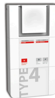
Type 4 - 1 boucle

Mode ESSAI permettant une installation plus rapide.