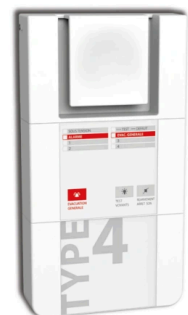
Type 4 - 4 boucles