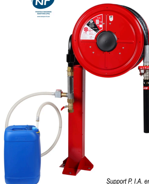
Support P. I.A. en option