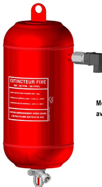
Modèle 6 kg avec contact alarme