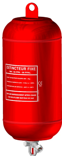
Modèle 6 kg sans contact alarme